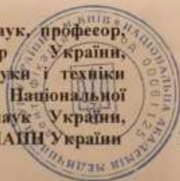
Віталій Федорович Москаленко

Доктор медичних наук, професор, заслужений лікар України, заслужений діяч науки і техніки України, академік Національної академії медичних наук України, член-кореспондент НАН України